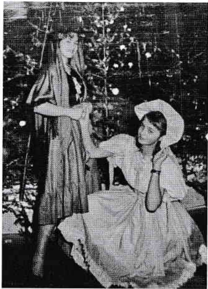
Carnaval în clasa a XI-a

1965, anul în care am dat examen la Facultatea de limbi germanice, secția Engleză a fost și anul ascensiunii la putere a lui Nicolae Ceaușescu. Perioada studiilor a coincis cu „dezghețul” produs între