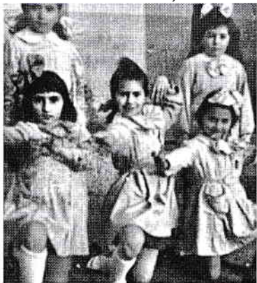
Serbare la sfârșitul clasei a II-a

Parcă aud și acum copitele cailor de la trăsura ce ne-a dus la gară, mirosul de fum al locomotivei, un miros care îmi făcea greață. După multe ore, am coborât în halta Dodeni, târând valizele după noi. Am ajuns cu căruța într-o casă cu pământ pe jos, unde am locuit un an, apoi am fost mutați într-o baracă de lemn, mai aproape de Bicaz. Tata pleca dimineața și mergea câțiva kilometri pe jos până la hidrocentrală, nu înainte de a mă lăsa pe mine la grădiniță. Când s-a apropiat data când trebuia să merg la școală, mama a