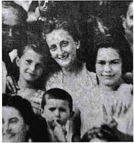
În excursie la Dunăre