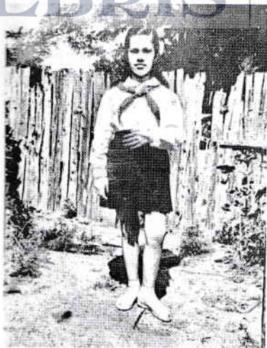
La 12 ani

am intrat la Liceul nr. 3 din orașul meu. Copilăria luase sfârșit, intram într-un capitol mai riguros. Trebuia să purtăm obligatoriu uniforma atât la școală, cât și în public, cu numărul matricol vizibil la mânecă. Seara nu aveam voie să fim văzuți în oraș – era motiv de exmatriculare. Nu aveam voie să purtăm ciorapi subțiri, ci numai groși, de bumbac (cu macaroane, cum le spuneam noi!), nici fuste mini. Băieții nu aveau voie să poarte părul lung. Dacă erau prinși cu plete, erau ridicați de pe stradă de miliție. Iar în provincie, milițienii făceau exces de zel, poate mai mult decât în Capitală.