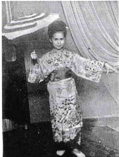
Serbare la sfârșitul clasei a IV-a